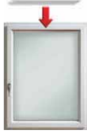
Durch die Montage der Glasleiste oder der Abdeckleiste wird die Klebefuge abgedeckt.