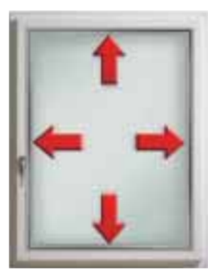
Die Glasscheibe wird in den Rahmen eingesetzt und zentriert.